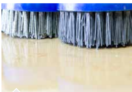
Superficie de piedra natural

Los cepillos Antike Floor pulen las partes mas suaves de las piedras dejando expuesta la parte mas dura. Se crean así ondulaciones transforman el piso en anti-deslice.