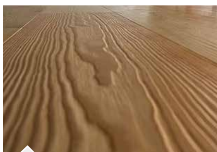
Superficie de madera